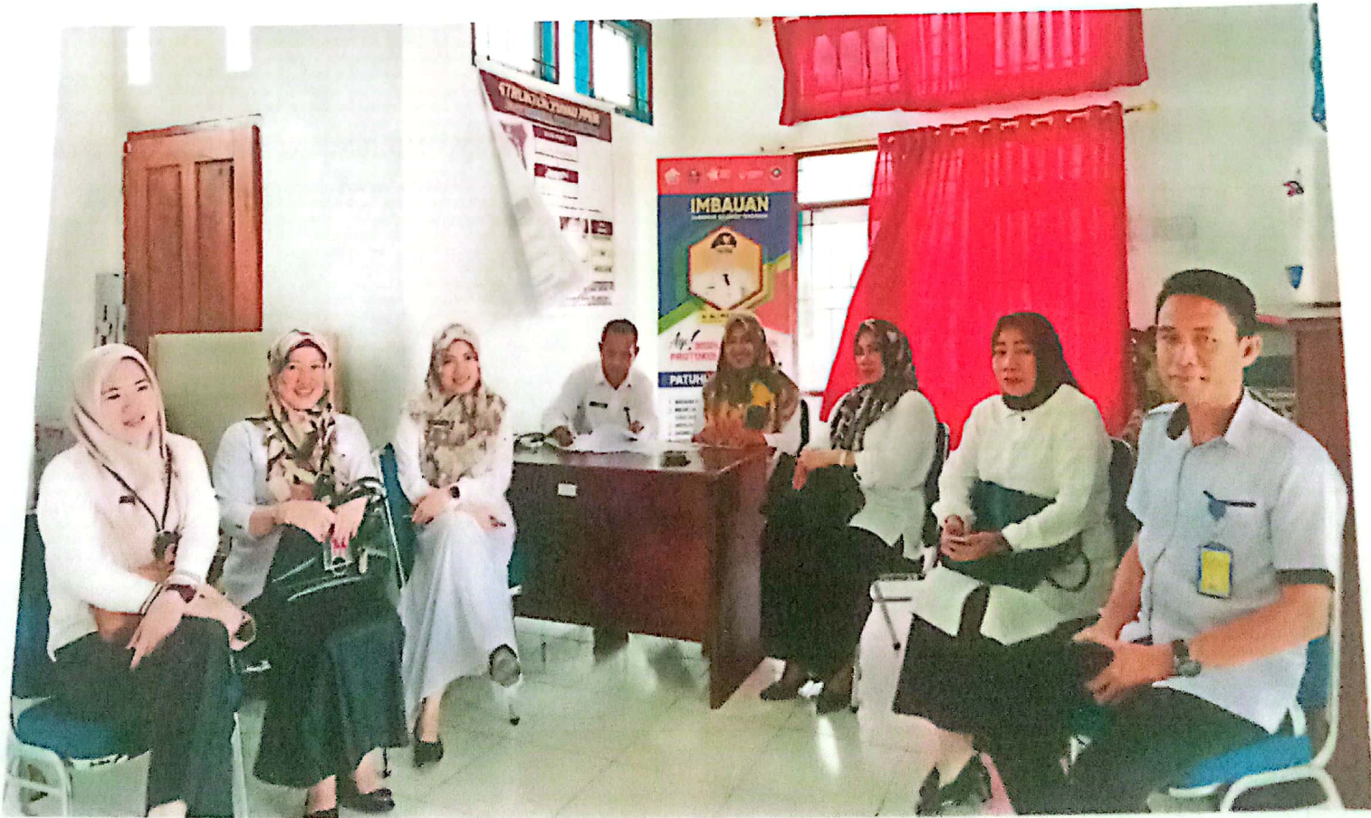
Ket; penanganan pengaduan bersama pemerintah Kelurahan Bangkudu Tahun 2022