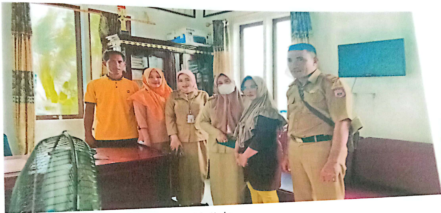
Ket ; Bersama Aparat Desa Banu-banua Jaya dan Pelaku Usaha