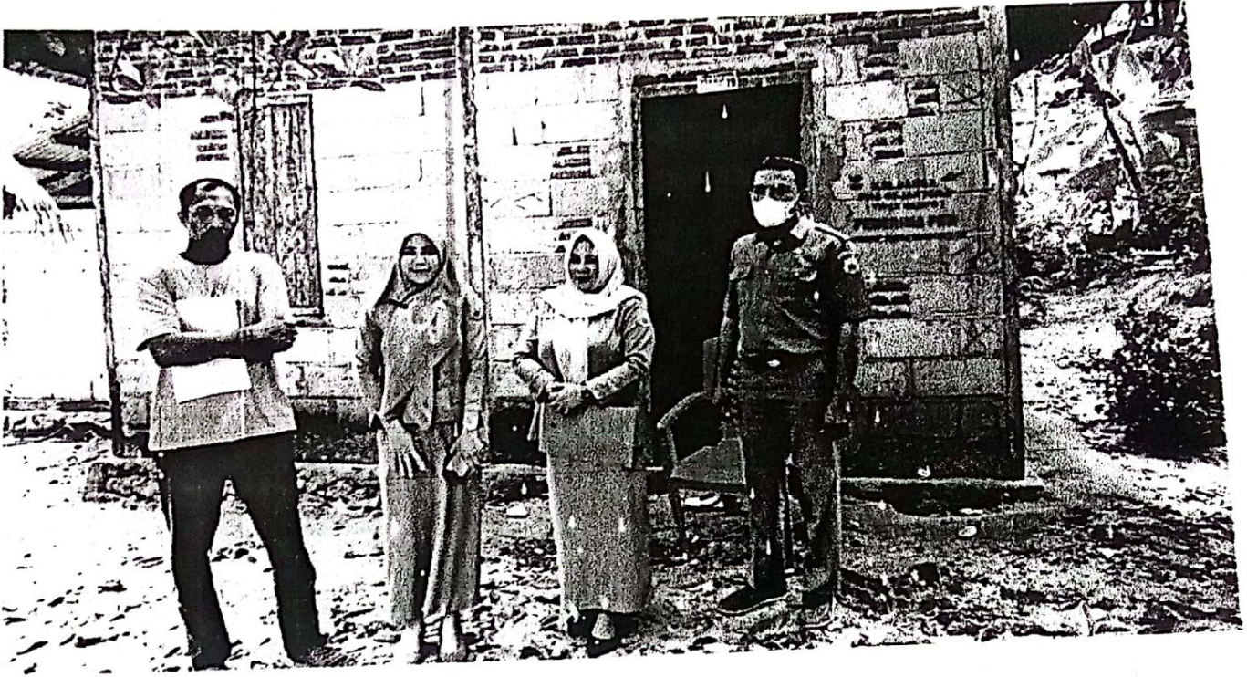
Ket: Lokasi desa E'erinere 2023